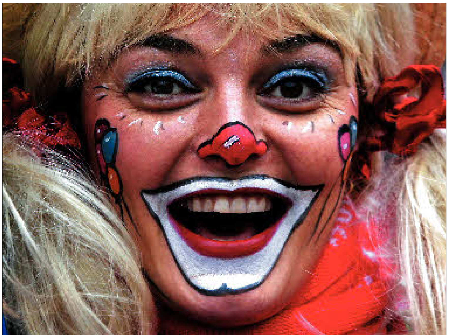
Die Fähigkeit zum Clown tragen alle Menschen in sich – und dem Narren geht es um Wahrheit und Freiheit.

Wenn wir offen lachen, ist der Filter unserer Prägungen weg. Wir lachen aus dem Herzen, aus dem Bauch heraus. Lachen wir hingegen aus unseren Prägungen heraus, nutzen wir die Komik, um unsere Abschätzung auszudrücken, um uns gegen das Fremde abzugrenzen. Wir lachen, um Peinli-